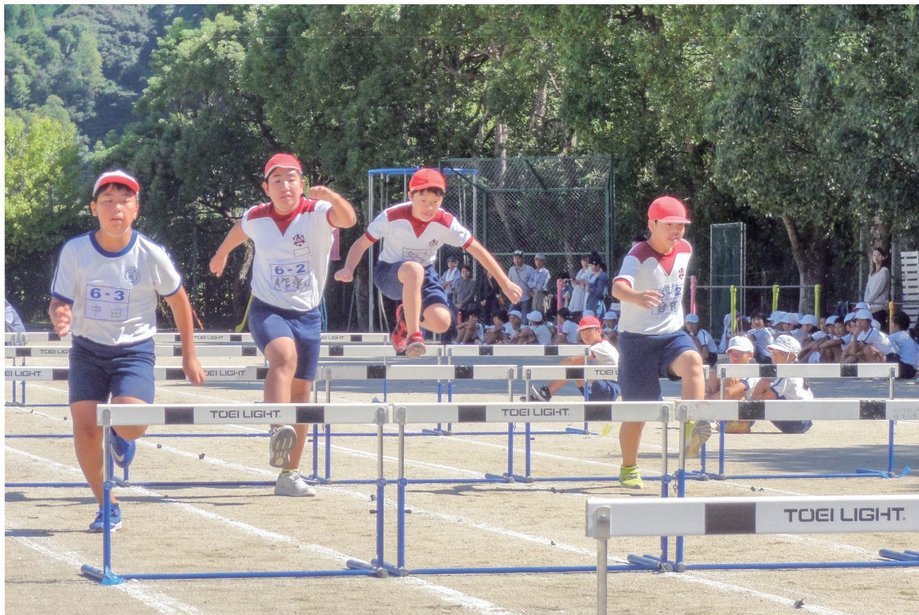
佐々町小学校陸上記録会(10月3日・佐々小グラウンド)