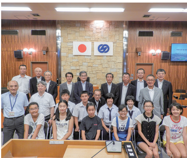
子ども議会を終えて

わたくし達が佐々町のために行えることはまだ少ないですが、今回提案された意見が実現されることを期待して、次はわたくし達の方で、このまちを愛いっばいに、していきたいと思えます。