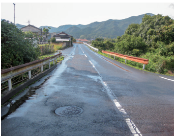
神田線歩道未整備の状況