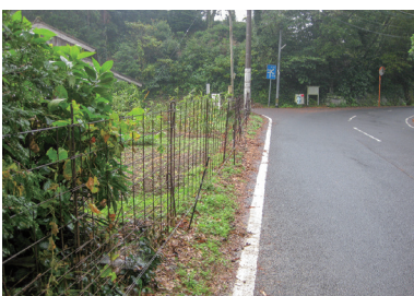
腐食が進む中山間ワイヤメッシュの状況