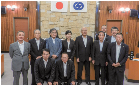
▲定例会終了後、議員の皆さんと

会議録反訳業務では、子ども議会の反訳に関わった。小中学生が当事者意識を持ち、皆で自分たちのふるさと佐々町をより良くしようとしている様子が伝わってきた。2015年に18歳選挙権が導入され、ますます若い世代の政治参加が求められている。まず身近な町の問題について関心を寄せ、他人事から自分事として捉えることで政治意識を向上させる良いきっかけになると思っ