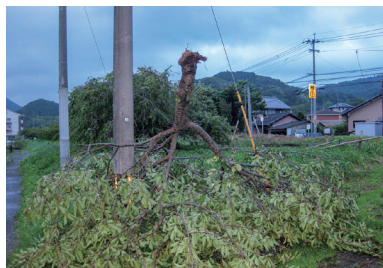
平成30年7月台風による河津桜倒木の状況