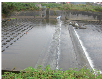
災害で破れた栗林井堰