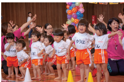
さざなみ保育園運動会 10月7日(日)

佐々町議会では、傍聴をされた方からご意見・ご要望をいただき、今後の議会運営に役立ててまいりたいと考えています。アンケート用紙につきましては、議場傍聴席入口に設置してありますのでご協力よろしくお願いたします。