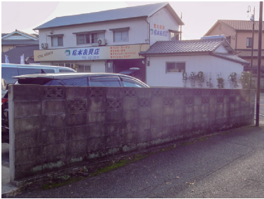
町道小丸山線のブロック塀

主な内容 歳出は、大阪府でのブロック塀の倒壊で、女児が死亡した事故を受けて、公共施設の緊急点検を実施し、町道小丸山線の公園のトイレや小中学校のブロック塀を撤去する等の工事費が補正されました。