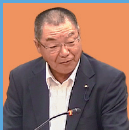
議員 橋本 義雄