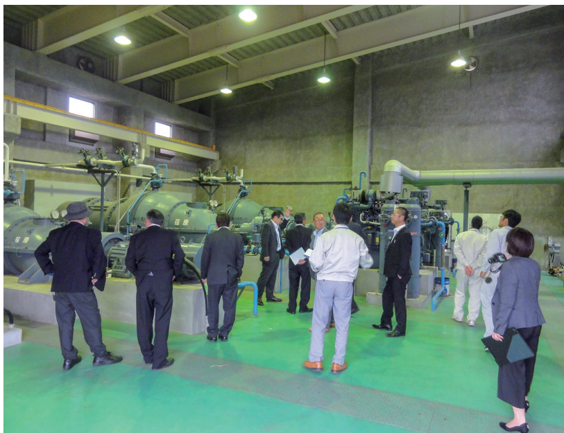
大新田排水機場の現地確認

町の借金である一般会計の地方債残高は44億3534万円に、町の貯金である一般会計の基金現在高は56億1454万円になりました。