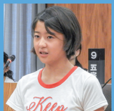
口石小学校6年 神戸 葵 議員

佐々町の観光資源や特産物の情報はパンフレットやホームページで発信しているが、十分ではないと考えている。キャラクターをはじめ、佐々町がもっと有名になるように、今以上、特色ある情報発信をはかっていかなければと考えている。