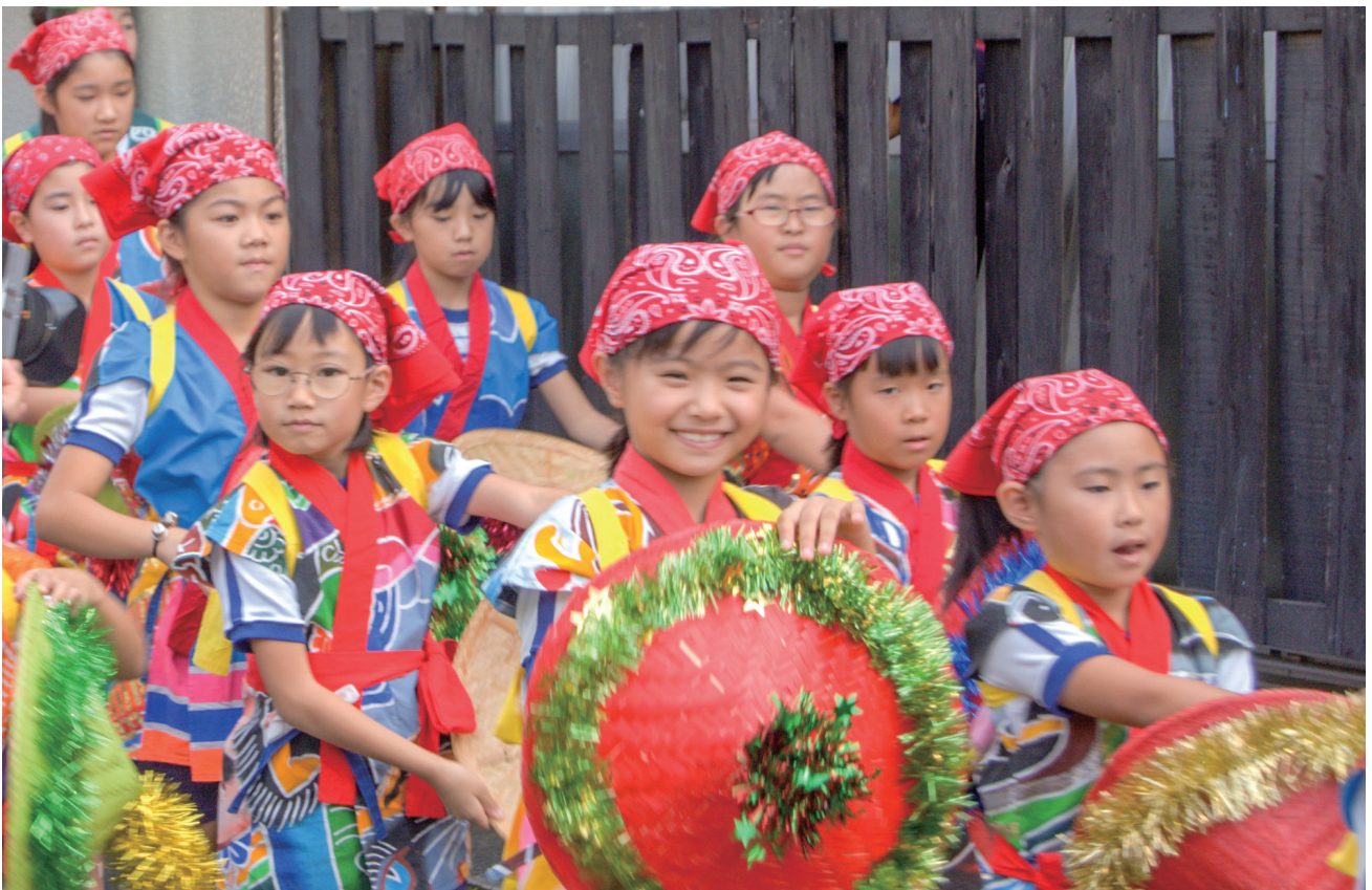
小浦おくんち子どもみこし(10月8日)