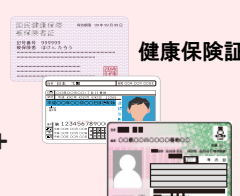
健康保険証 マイナンバーカード等