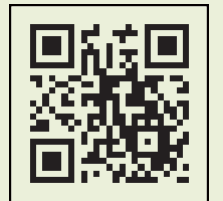
「コロナワクチンナビ」 二次元コード

新型コロナワクチンの有効性・安全性などの詳しい情報については、首相官邸ワクチン特設ページをご覧ください。