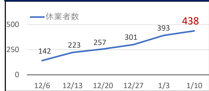
医療従事者の休業状況(44施設)