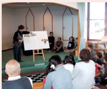
としよかん文化まつりの様子

恒例の古本市では、91名の方に197冊と60点を購入していただきました。また、無料の古本もたくさんお持ち帰りいただきました。