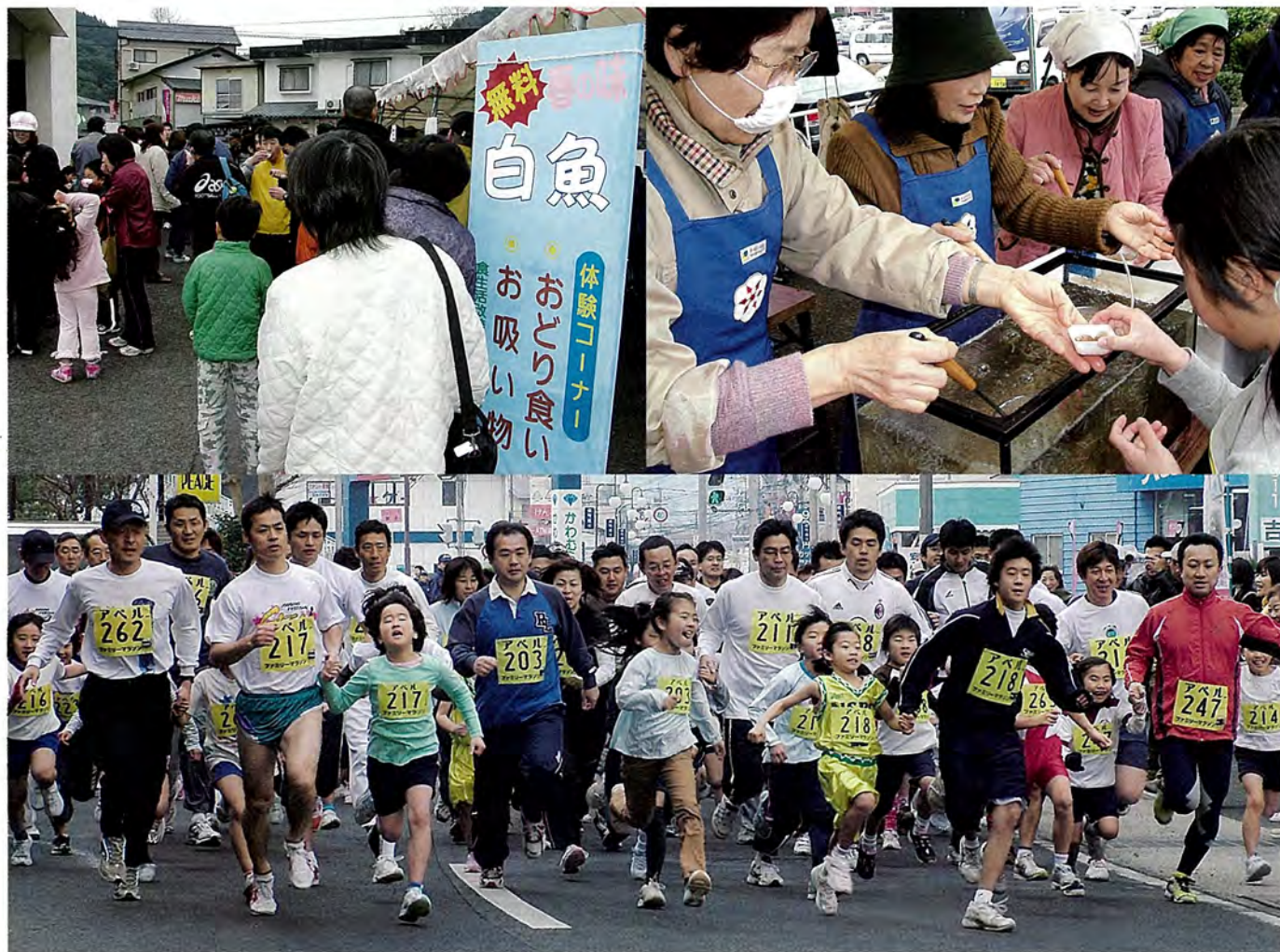
3月9日(日)に「白魚まつり」と「ジョギングフェスティバルinさざ」が行われました。