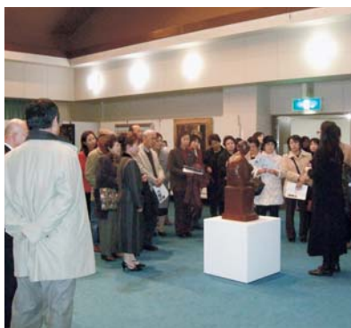
ギャラリートークの様子

12月6日から15日間、佐々町文化会館において、「長崎県美術館名品展 移動美術館」が開催されました。長崎県美術館所蔵の名作品26点の展示のほか、ワークショップ「フラタ1ペーパー」作りや小中学生を対象とした「鑑賞教室」、「ギャラリートーク」などが行われました。