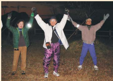
【リアルタイム(6:30)で実施しています】

佐々町を一望できるこの場所に魅せられ、始めは2人からのスタートで、だんだん仲間が増えていきました。新鮮な空気と故郷の景色とともに体を十分に伸ばし、清々しい一日をスタートすることができます。天気の良い日には雲海が見えるそうです。そしてもうひとつの魅力は、この頂上に昇るまでの坂道と百段の階段!!これが脚力を鍛え、心肺機能を高めています。80歳を過ぎた方も通われていますがその元気なお姿に感心する限りです。夢はNHKを通じて、この最西端で長年続くラジオ体操の活動を紹介し、佐々町で健康づくりの輪を広めることだそうです。『ラジオ体操をするお仲間をお待ちしております!みなさん、一度登ってこられませんか。』