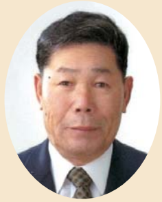
町長 二 耕 関