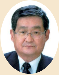
議 長 善 敬 川 副