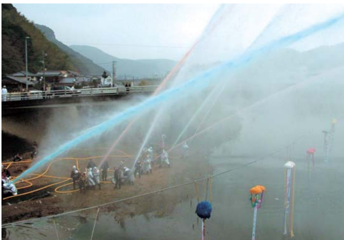
(昨年の様子 ※今回は鈴割りは行いません)