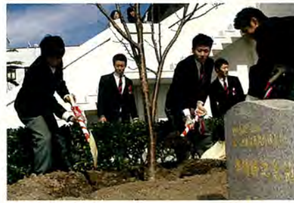
清峰ナインが記念植樹をしました

清峰高校卒業式が行われた3月1日、清峰高校野球部が役場前に春の選抜高校野球選手権準優勝の記念として、桜の木を植樹しました。