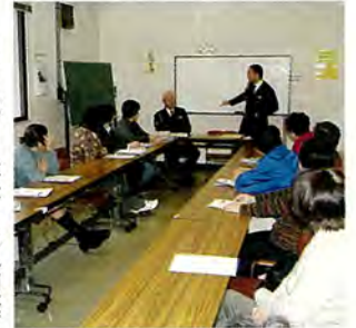
交通安全母の会交通安全講習会

コールドワニーは、20代から70代までの女性の合唱団です。毎週月曜日夜2時間の練習をされていて、全国大会にも2回出場しています。今回の30周年を記念して行われたコンサートには佐々町少年少女合唱団も出演し、大いに盛り上がりました。