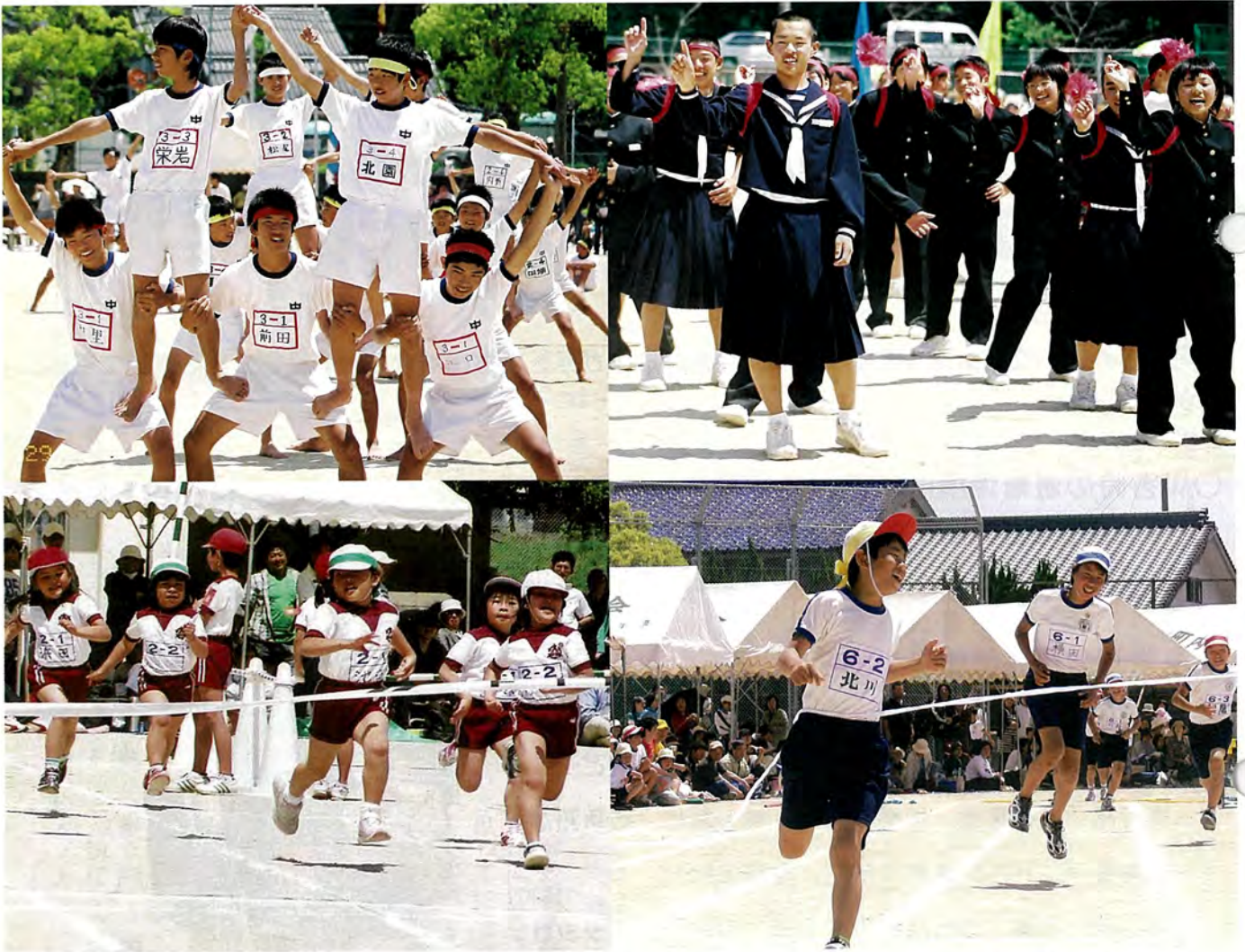
各学校で運動会が行われました（上段：佐々中学校、左下：佐々小学校、右下：口石小学校）