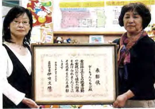
読み聞かせ図書ボランティアの「びーちゃんくらぶ」が文部科学大臣表彰を受賞!!

去る4月23日、子どもの読書活動実践において優れた効果をあげたことに対し、平成19年度『子どもの読書活動優秀実践団体』文部科学大臣表彰を受賞しました。