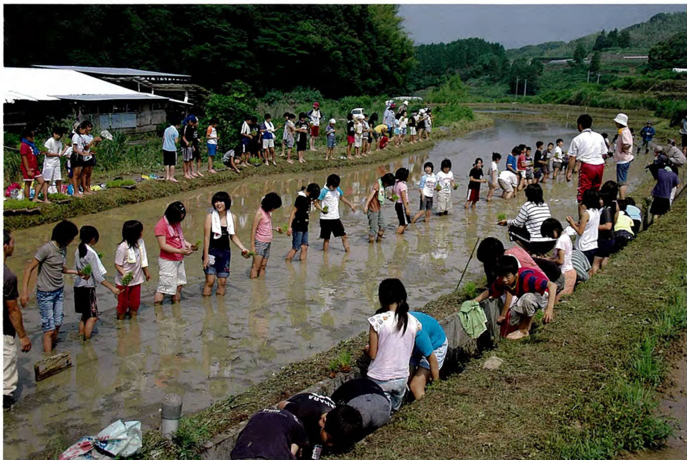
口石小学校の児童が田植えを体験しました（木場地区での様子）