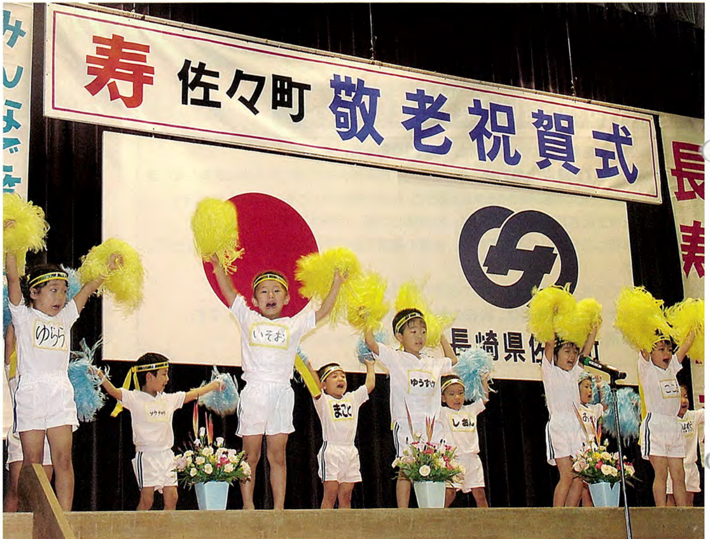
9月17日(月)に敬老祝賀式が行われました。