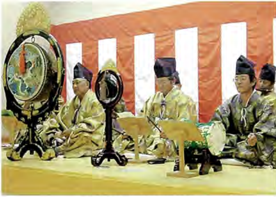
(昨年の演奏の様子)