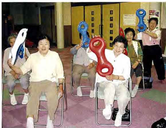
3B体操で体を鍛えています