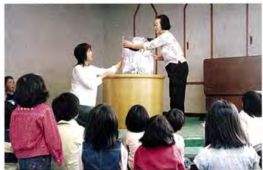
お話の世界にひたった「絵本の読みきかせ」