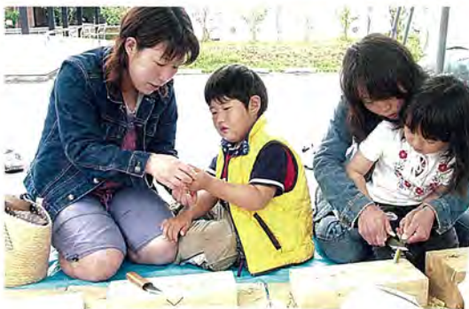
親子で力を合わせて竹とんぼづくり