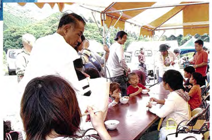
▲27日には冷しそうめん、28日には冷ししるこが振る舞われました。