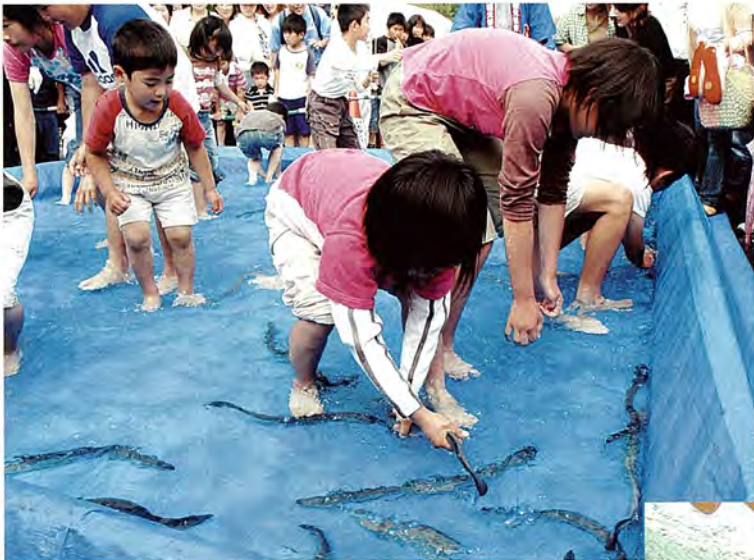
▼「うなぎのつかみどり」では、子どもたちが悪戦苦闘！

第14回目を迎えた血山まつりが5月27・28日の2日間に渡って開催されました。当日はあいにくの雨模様でしたが、日曜日に開催された「イチゴ狩り」には多くの人が参加し、イチゴをたくさん持ち帰っていました。また、血山直売所が1周年を迎えた記念に、冷しそうめん、冷ししるこの無料配布が行われるなど、いろいろなイベントが催され、来場者を楽しませていました。