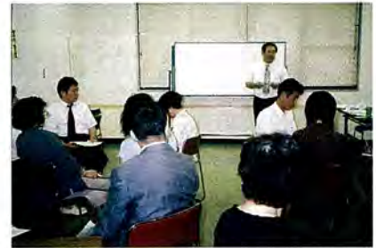
▲ワークショップの様子

後半の県人権・同和対策課職員による講義には、「明生大学・成人学級・さざんか教室」の受講生も多数参加し、日常の人権意識の大切さについて熱心に聴き入っていました。