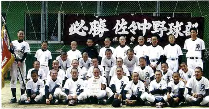
優勝した佐々中軟式野球部