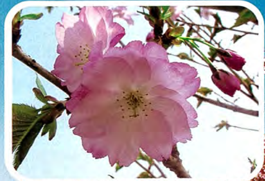
【紅・豊】 べにゆたか