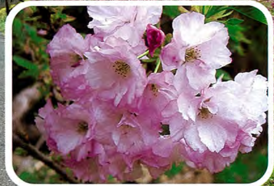
【八重紅虎の尾】 やえべにこらのお