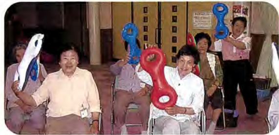
(リズムに合わせて3B体操で体をほぐしています)