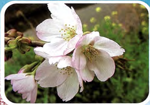
【苔清水】 こけしみず