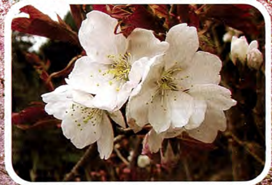
【西方寺】 さいほうじ