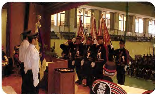
消防庁長官表彰に団長・副団長登壇 (H17.6.4)