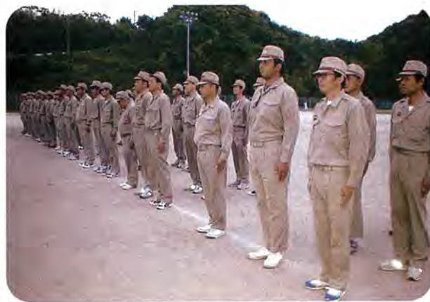
5月28日（土）町民グラウンドにて訓練実施

消防団員の厳正な規律の保持と迅速的確で秩序ある団体行動を行うため、2年に一度礼式訓練を行っています。佐世保市消防西消防署佐々出張所長をはじめ、6名の教官を派遣していただき、約2時間の訓練を実施しました。