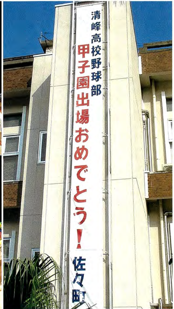
清峰高校野球部が県大会で優勝して甲子園初出場を決めました。（写真は報告会の様子）