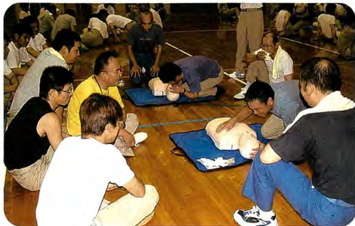
平成17年7月8日 町民体育館にて

教官として佐世保市西消防署佐々出張所から6名の署員を派遣していただき、団員74名が約2時間、熱心に訓練に取り組みました。