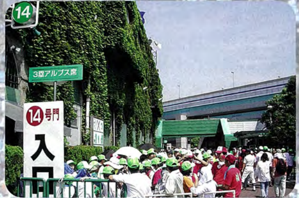
あこがれの甲子園到着