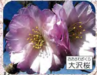
あさむぎくら 大沢桜