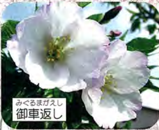
みくるまがえし 御車返し