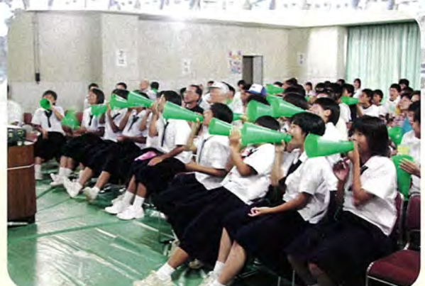
文化会館 一進一退の試合展開に会場は盛り上がりました。