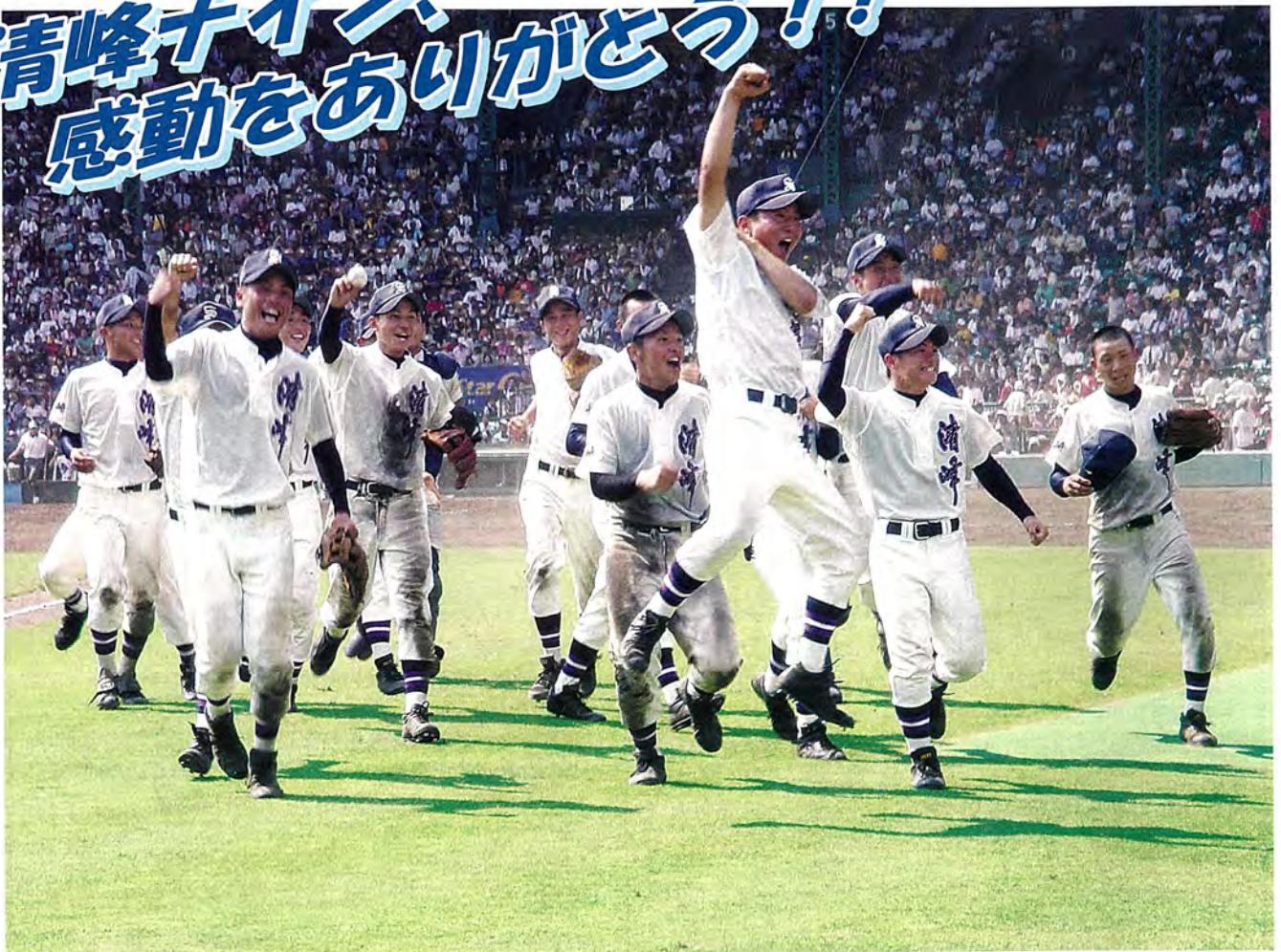
清峰高校野球部は甲子園初出場ながら今春の選抜優勝校、昨夏の準優勝校を破るなど大健闘しました。