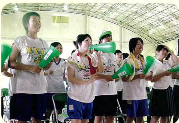
清峰高校体育館 留守番組也大興奮!