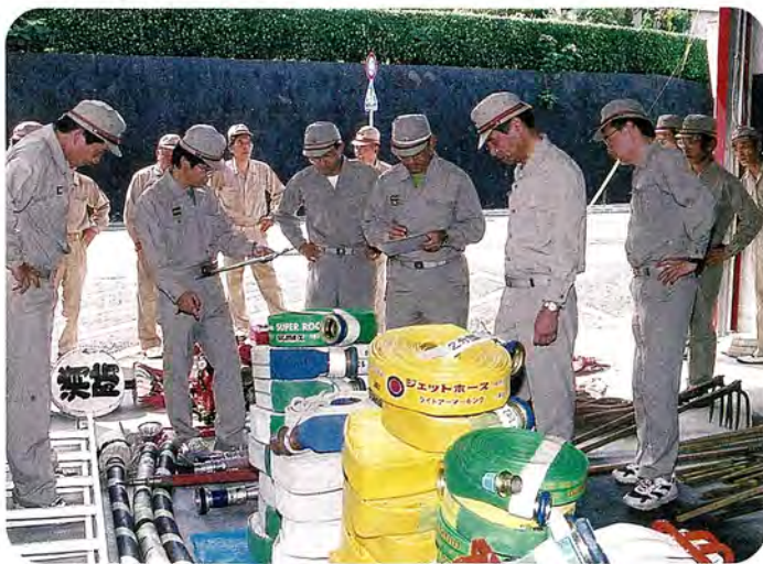
8月7日 第2分団詰所(神田)での備品検査の様子