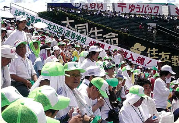
応援席も準備よーし!