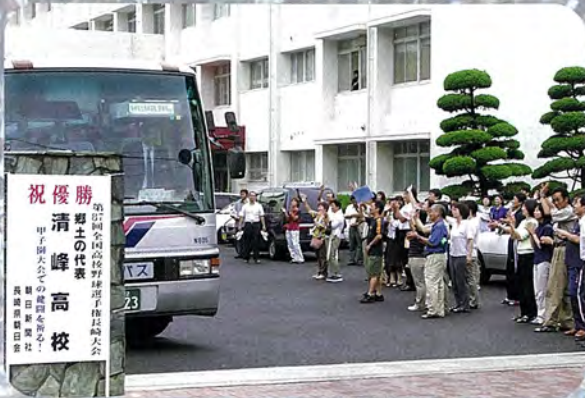
甲子園にむかって出発

清峰高校野球部の甲子園出場は佐々町の名を全国に知らしめました。 町は清峰ナインの活躍に大いに沸きかえりました。