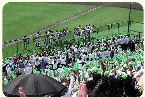
歓声に応える清峰ナイン