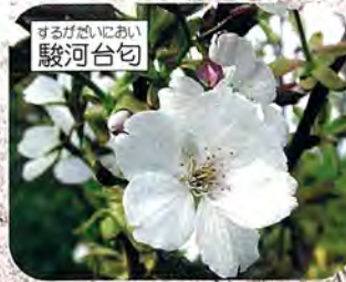
するがだにおい 駿河台勾