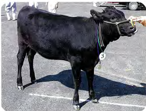
今年のグランドチャンピオン もも号

なお、上位入賞は10月20日に開催される県北地域和牛共進会へ佐々地区代表として出品されます。