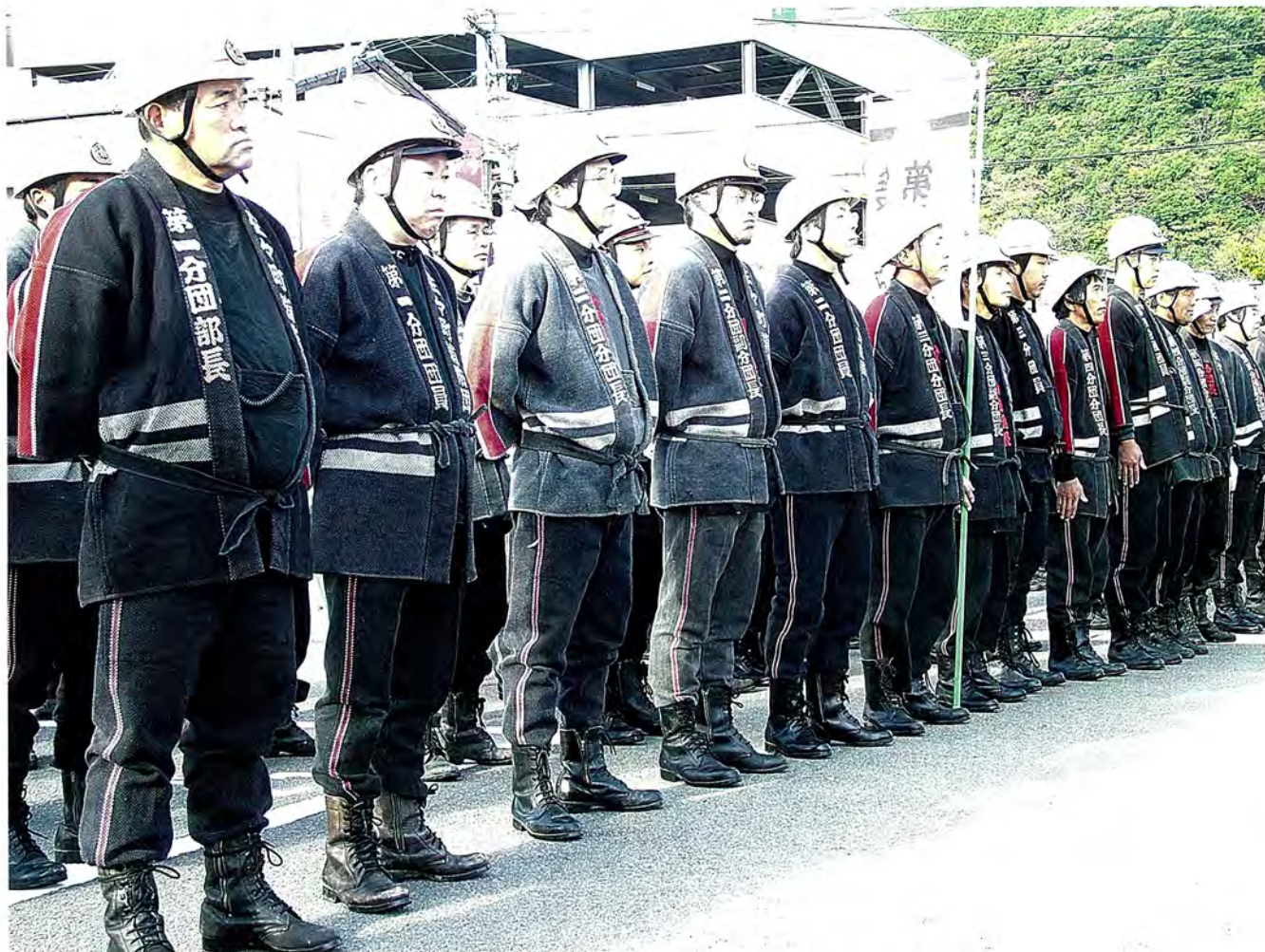
11月13日(日) 秋季火災想定訓練が実施されました(12ページに関連記事)