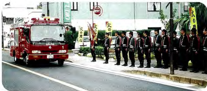
H17.11.9 北松南部消防協議会主催 防火パレード