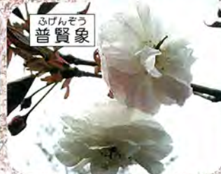
ふげんぞう 普賢象