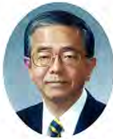
長崎県知事 金子原二郎