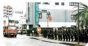
↑3月1日、北松南部消防協議会主催『防火パレード』を実施しました。