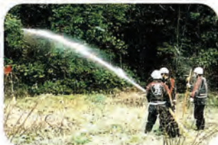
3月7日、春季火災想定訓練(林野火災)を実施しました。↓