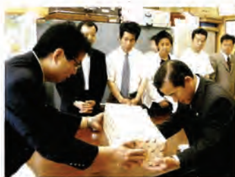
商工会青年部代表による防犯ベル寄贈の様子

佐々町商工会青年部は、積極的に町内行事などにも参加されており、今回、最近の子ども達を取り巻く環境が非常に厳しいので、青年部として何かできないかと熟慮の結果、口石小学校に120個、佐々小学校に80個の防犯ベルを寄贈されました。