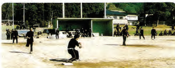
分団対抗ソフトボール大会の様子

まだまだ未熟ではありますが、どうぞよろしくお願いします。(※次回は、第1分団長を紹介します)