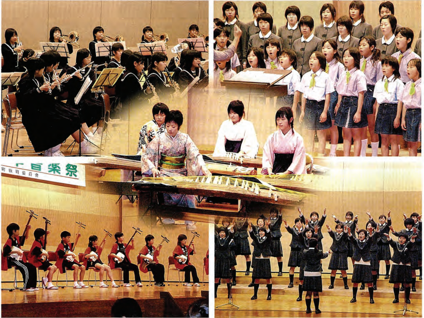
11月13・14日に行われた文化祭の様子