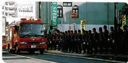
11月9日に行われた消防防火パレード