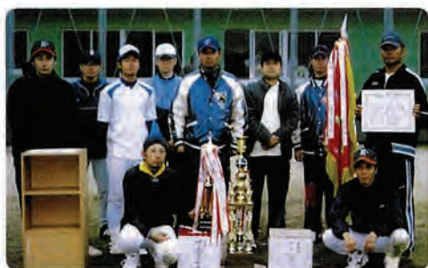
優勝した サイドギャザーチーム