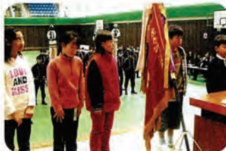
夜警など防災協力した子ども会を表彰