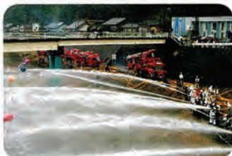
一斉放水！鈴割りにてフィナーレ