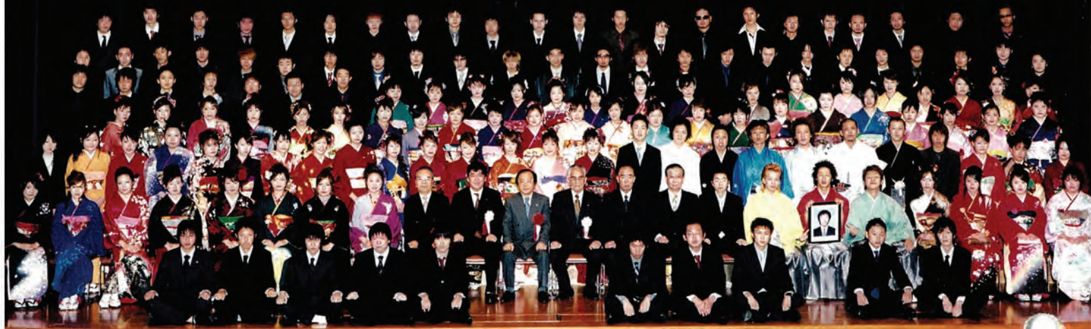
(写真は1月5日に行われた成人式。関連記事12ページ)