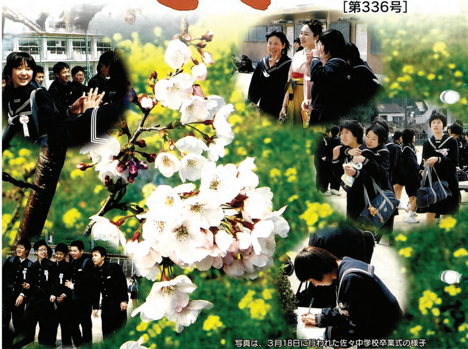
写真は、3月18日に行われた佐々中学校卒業式の様子