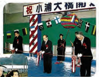
渡り初め式の様子

小浦大橋の完成により延長750mの町道サン・ビレッジ線が完成し、車両の交通混雑解消および小浦地区の開発の促進が期待されています。