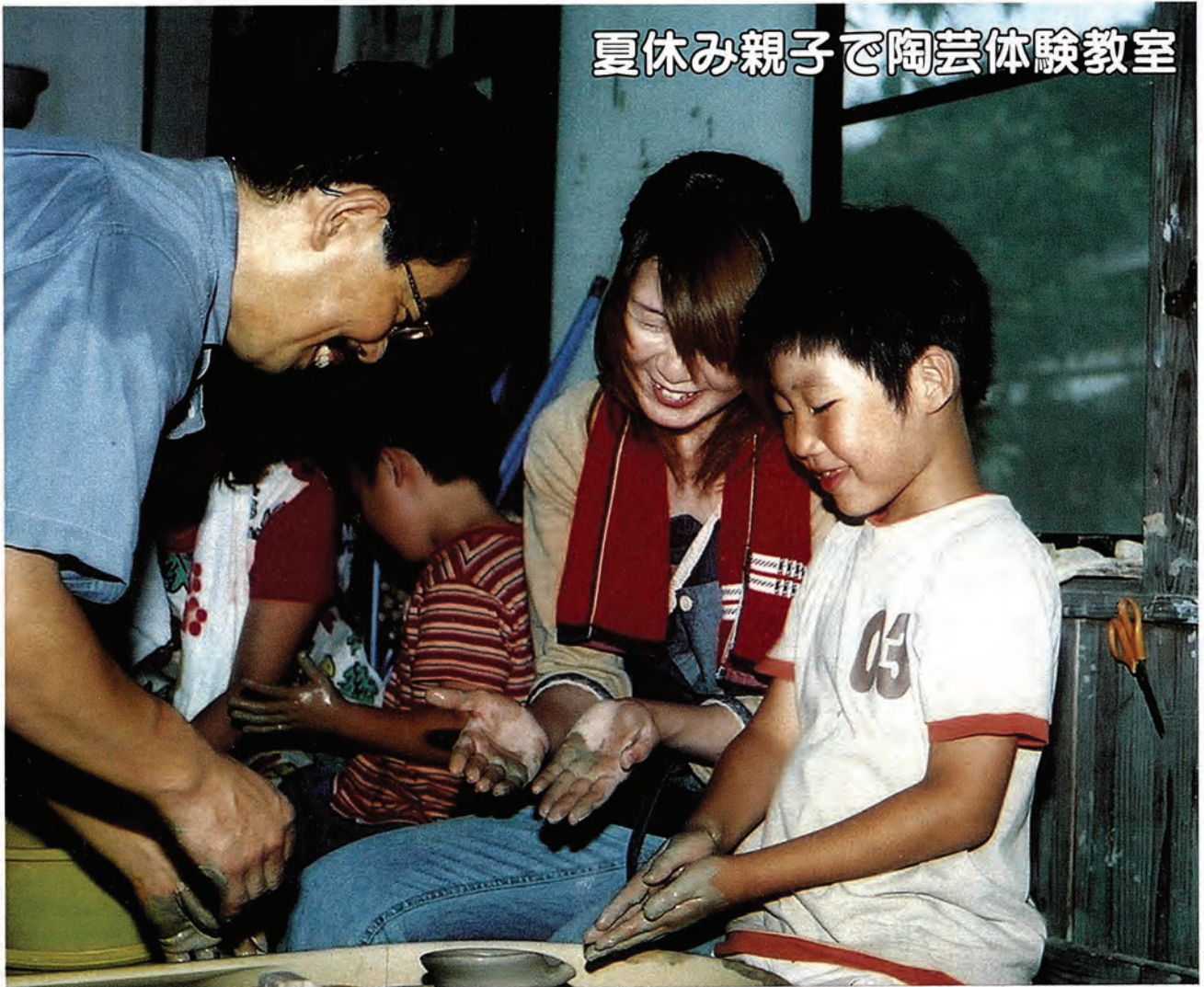
夏休み親子で陶芸体験教室