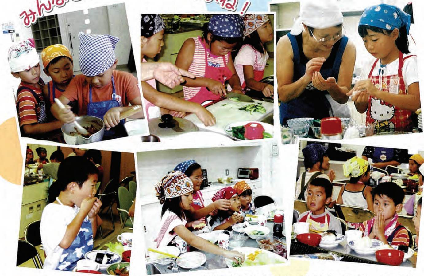
学童保育のみんなでおにぎりづくり (健康相談センターにて)