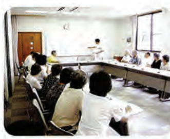
—介護者の会で勉強会開催—