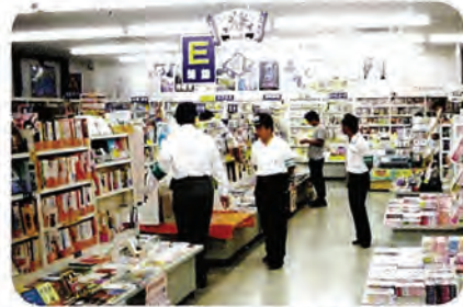
県下一斉街頭補導日

7月におきた長崎市内の男児誘拐殺害事件をうけ、少年非行防止運動への取り組みをさらに強化するため「江迎警察署特別少年補導隊」が結成され7月29日に発足式が行われました。毎月第1金曜日の「県下一斉街頭補導日」をはじめ、必要に応じて商業地の巡回、飲酒・喫煙・深夜徘徊などを行う少年への適切な助言や、人命の尊さなどを指導することを目的としています。