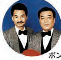
ボンボンブラザーズ