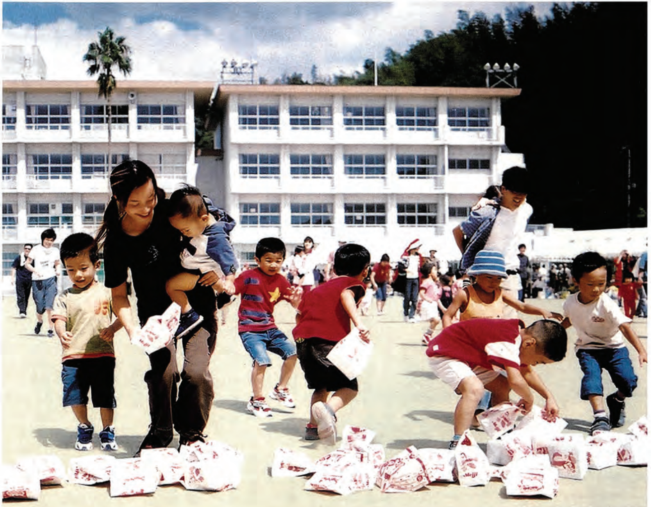
(9月21日(日)に行われた町民大運動会。関連記事13ページ)