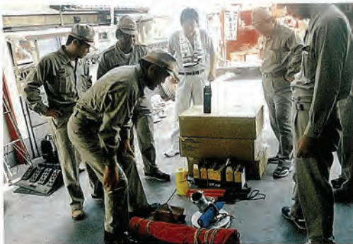
8月に行われた備品検査の様子