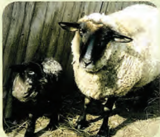
学童農園のヒツジに赤ちゃんが生まれました。みんなかわいがってね。