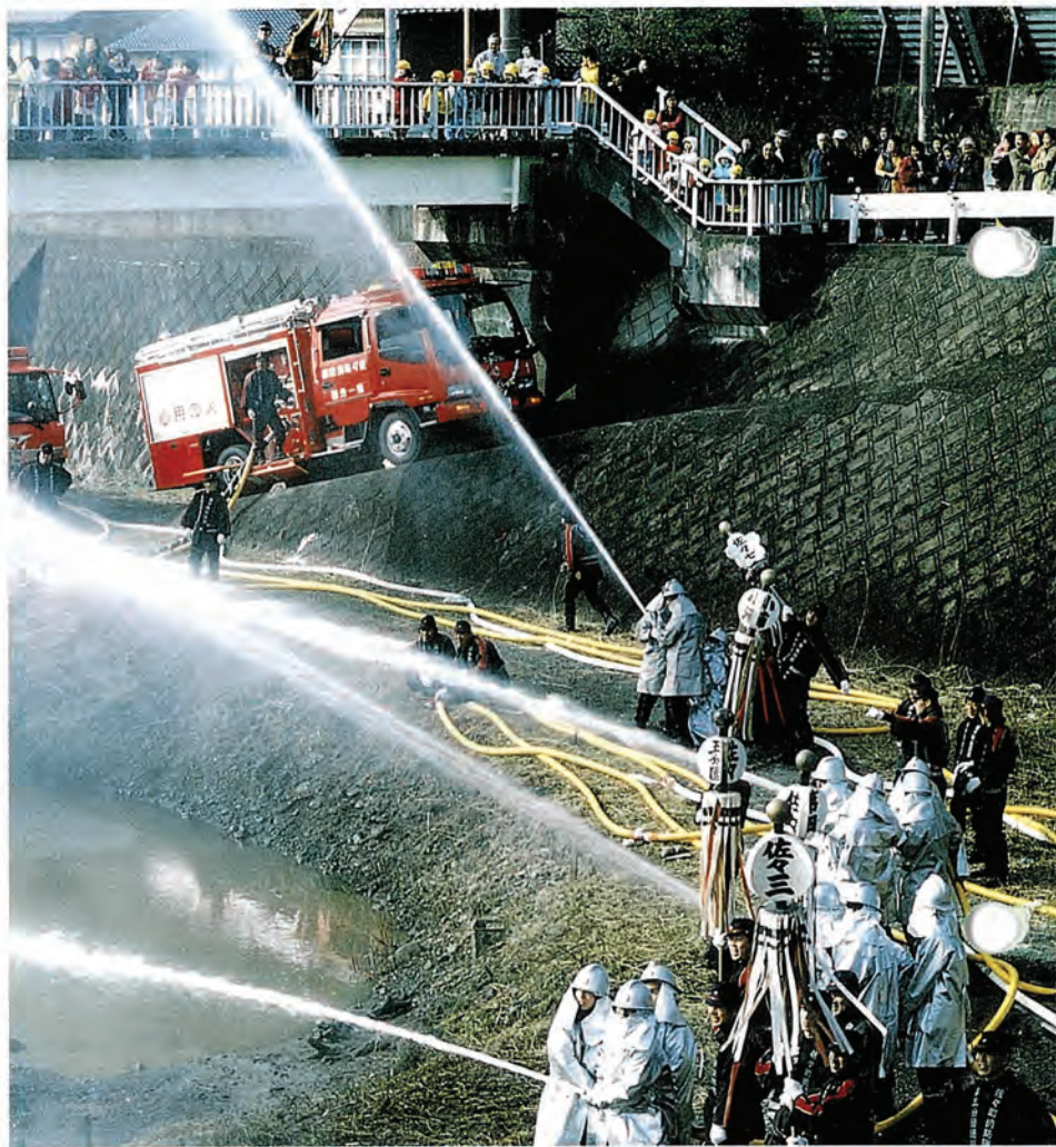
消防出初式での鈴割の瞬間(関連記事8ページ)