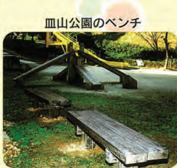
皿山公園のベンチ