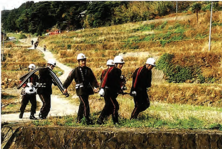
写真は、本通りの消防車から下方の水利(川)まで重たい機械(ポンプ)を運んでいる様子です

きつい場所に当たってしまうと、口では「なんでこがせんばとや」とか言いながらも、いざ火災という時のための訓練ですので、とにかく早く連結しようと訓練の目的達成のため、頑張っています。