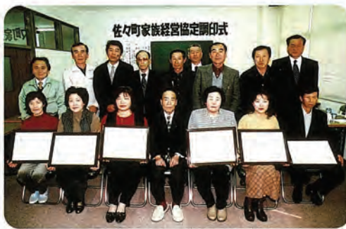
調印された農家の皆さん

簿記記帳、青色申告の実施、労働日の記帳、後継者の養成・育成の取り決め 以上のことが課題としてあげられています。