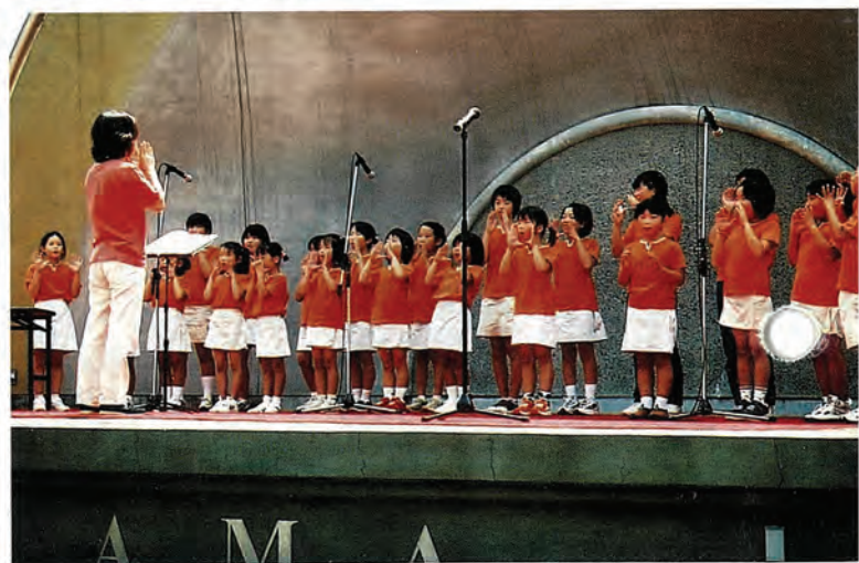
(6月8、9日に行われた皿山まつりの様子)