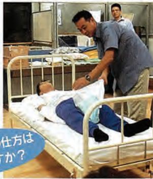
おむつ交換の仕方は分かりますか？

高齢者およびその家族の悩みごと、困りごとに関する相談（法律相談・一般相談）のお知らせ