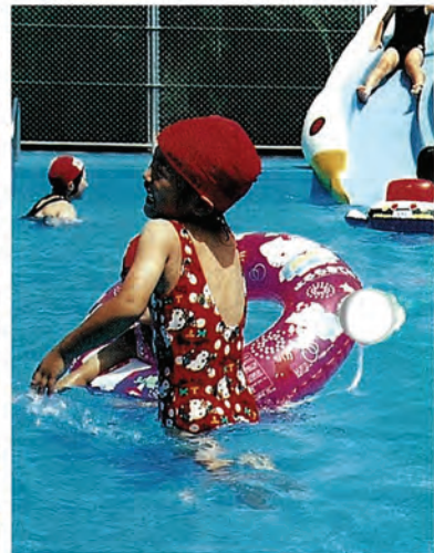
(新しくなった千本公園プールで歓声をあげる子どもたち)