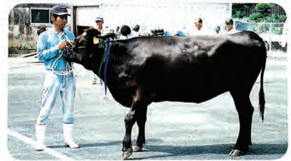
グランドチャンピオンのあきえ号