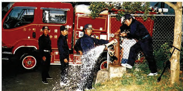
消火栓の点検状況

これらの消防水利については、各分団および消防署(佐々出張所)で定期的に「防火水槽に水は入っているか。消火栓のバルブはスムーズに動くか。」などの点検を行って、万一の際に備えています。