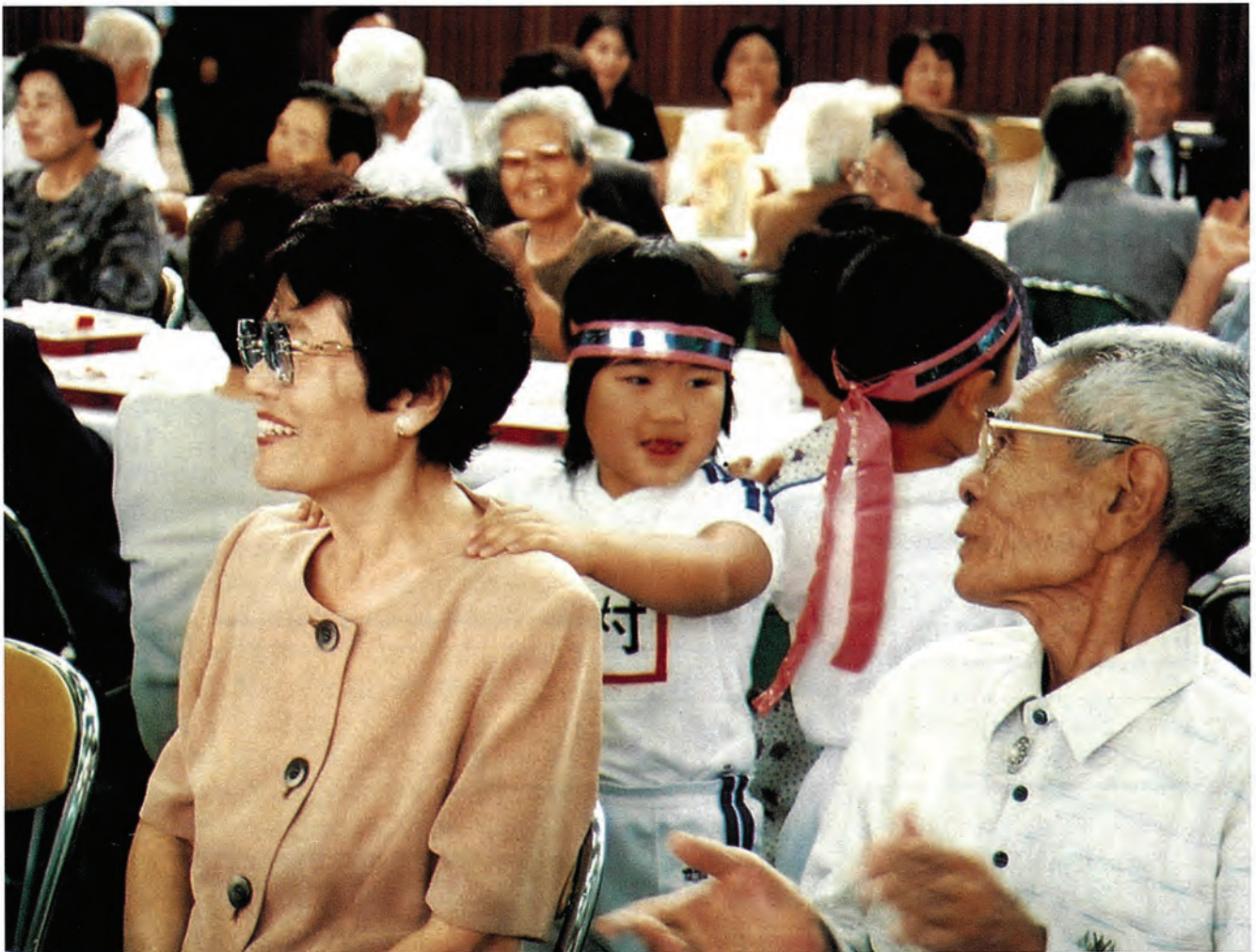
9月15日（日）に行われた敬老会の様子