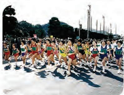
写真は昨年の大会から