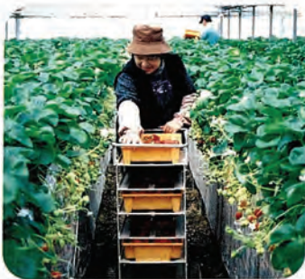
ベンチ栽培での収穫の様子

それから100年近く経った昭和24年ごろから佐々町神田地区で露地栽培が始まりました。その後、ビニールの登場によりトンネル栽培を取り入れ、ハウス化へとすすみ、町内に普及していきました。現在では「ベンチ栽培」という新しい栽培法も取り入れられています。