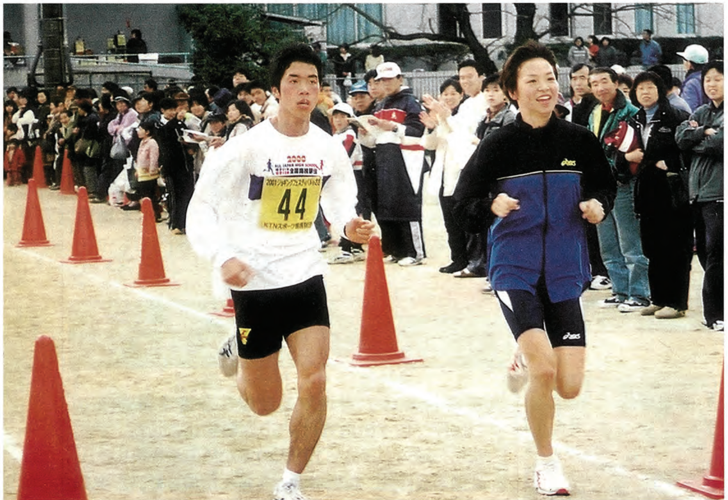
(写真は3月11日に行われたジョギングフェスティバル。関連記事10ページ)