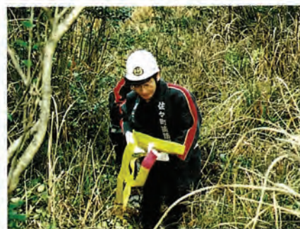
道なき道にホースを張る団員

消防団員は、それぞれ別々の生業を持ちながら、火災などの災害時には、いち早く駆けつけ、町民の生命・財産を守るため、日ごろからこうした訓練を積み重ねています。これからも、皆さまのご理解とご協力をお願いします。