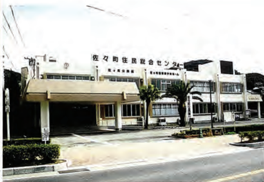
改修工事が終わった住民総合センター

公民館（1階）、勤労青少年ホーム（2階）の改修工事が3月で終了しました。 皆さまには、大変ご迷惑をおかけしましたが、4月1日から利用できます。部屋の貸し出しなどは、公民館の窓口で行います。よろしく願います。 （☎6256294）