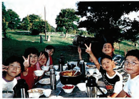
昨年のサマーキャンプから

対象は、小学校5・6年生で、内容は生活・自然体験が中心ですが、佐々町の郷土学習や飯ごう炊さん、天体観測なども行います。