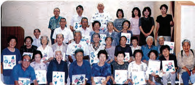
神田地域デイサービスの皆さん。朝顔の色紙づくりで楽しみました