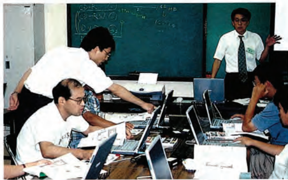
画面を見る目も真剣です