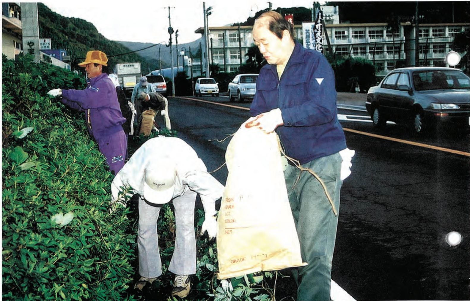
(写真は、11月4日早朝に行われた清掃活動の様子)