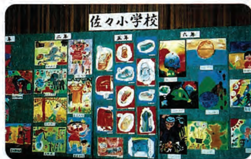
文化祭での展示の様子

んや一般の方が、反射板の効果もあり、胡弓やピアノの演奏に酔いしれていました。 また、町民体育館では、文化協会、公民館、勤労青少年ホーム、生きがいと創造の家の各グループや町立幼稚園、小・中学校、個人の作品が昨年以上に展示されました。 2日目には、文化会館で、文化協会ほか各グループの舞台発表が行われ、今年も例年と趣向を変え、午前中に所作台を使用している謡曲・舞踊・箏曲を行い、午後からダンス・大正琴・バレエなどの発表があり、たくさんの方の聴衆を魅了しました。