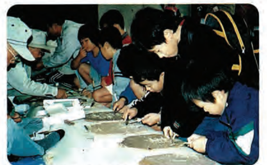
子どもフェスティバルの一場面

当日は、約500名が参加し、お手玉・丸太切り・ドッジボールなど18種目のコーナーで様々な体験をしました。