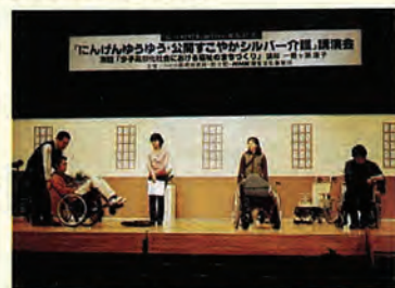
公開録画のリハーサルのような様子

■放送予定 平成14年2月27日(水) 教育テレビ 午後7時30分から30分間 (再放送) 平成14年2月28日(木) 教育テレビ 午後1時5分から30分間