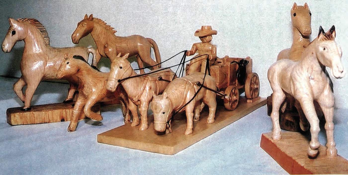
(写真は生きがいと創造の家木彫教室会員の皆さんの作品)