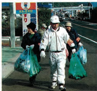
たくさんのごみが集まりました

社会福祉協議会では、ごみのないきれいな街づくりを進めようと12月9日(日)、福祉協力員、職員22名が参加して『歳末クリーン活動』を行いました。