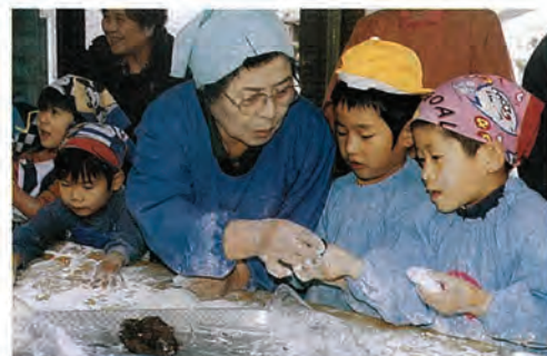
おいしいもちができました

福祉センターに、泡ぶくぶくのおあったかい風呂があるのをご存じですか？ 囲碁や将棋、カラオケを楽しみ、お風呂で温まり、寒い冬を乗り切りましょう。 ご利用時間などは次のとおりです。