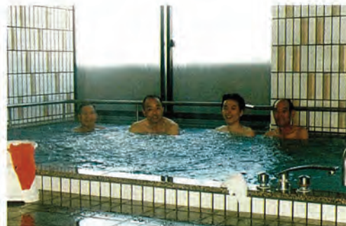
広々としていい湯かげんです