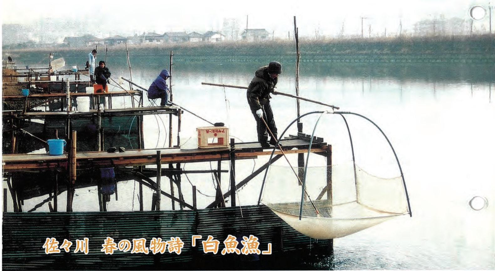
佐々川 春の風物詩「白魚漁」