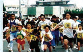
写真は今年の大会から