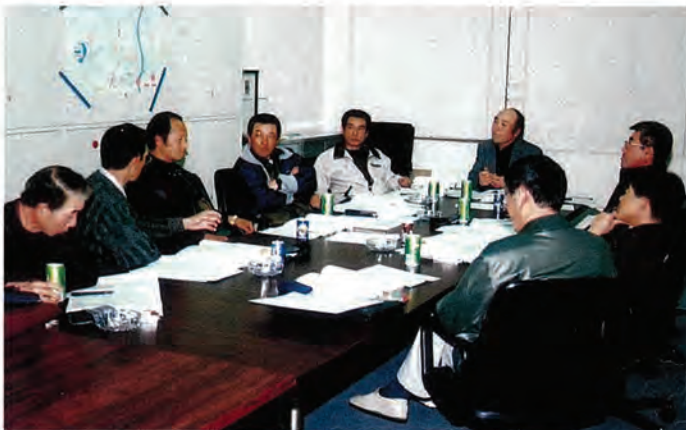
※写真は、2月15日の分団長会の様子です。

会議中は賑やかなもので、真剣に協議する中で時折冗談が飛び交い、あっという間に約2時間の会議も終了します。会議室の外から様子を伺うと、「笑い声ばかりで、何をしているんだろう。」と思われそうなくらい賑やかな会議ですが、この和やかな雰囲気から、分団間で少々無理な頼み事ができるほどの融和が図られ、「いざ」という時にはスムーズな連携が取れる体制が整っています。