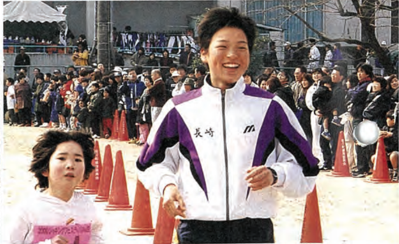
(表紙の写真は、3月12日に行われたジョギングフェスティバル in さざより)