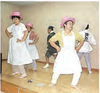
息の合ったダンスを披露する土手迎地域デイサービスボランティア

ご利用を受けましたら担当の職員が訪問し、お困りごとの相談をお受けします。 利用者の相談内容により、援助契約、支援計画等を作成します。作成した契約内容に沿って、地元の生活支援員が定期的に利用者宅へ出向き、福祉サービス