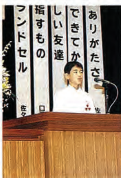
▲写真は去年の大会より

大会後、中学生の発表者1名が県北地区の代表を決定する選挙へと進みます。 町民の皆さんの多数のご来場をお待ちしています。