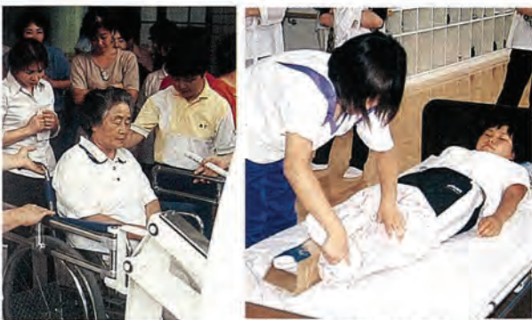
▲11年度ホームヘルパー3級課程介護実習

佐々町社会福祉協議会では、平成8年度から毎年「誰でも住み続けたいなる福祉で町づくりの町佐々町」を目指して、実技、実習を中心に高齢者介護の知識や技術を習得し、佐々町に住むすべての人々が支え合い、安心して生活していくための人材を育成しています。 今年度は、長崎県緊急雇用対策事業の一環として、「ホームヘルパー養成3級課程研修会」を次のとおり開催しますのでお知らせします。