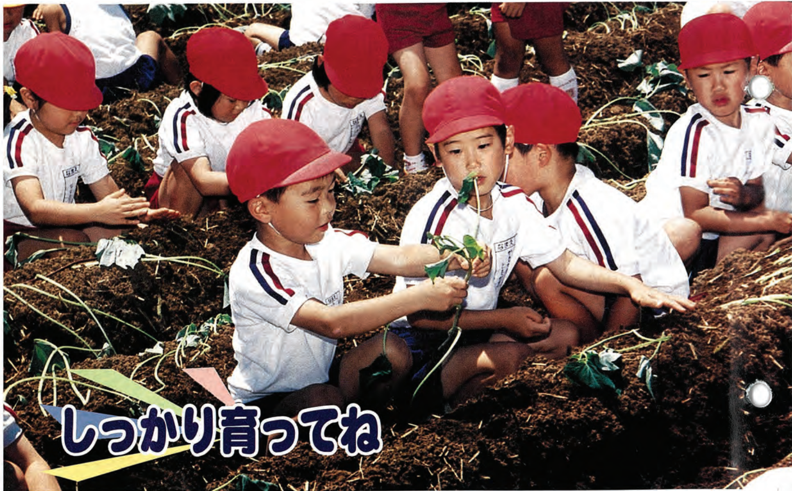
(写真は6月5日に行われた佐々幼稚園児によるさつまいもの苗の植えつけの様子)