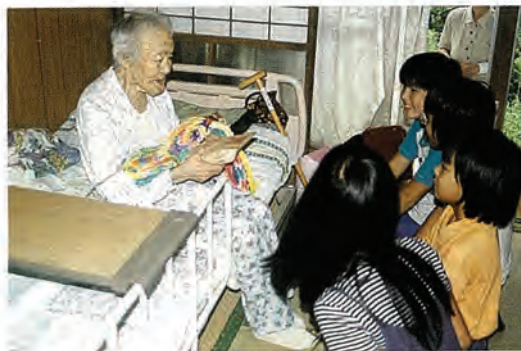
口石小児童の敬老お見舞訪問

昨年、皆さまの善意により、906、403円のご寄付をいただき誠にありがとうございました。 皆さまからのご寄付は、県共同募金会を通し、社会福祉協議会が行う地域福祉事業や民間の社会福祉施設などに還元され、地域福祉充実のために使われます。 本会は、2、158、000円を還元金としていただき、福祉協力校（小・中・高）のボランティア活動援助、各ボランティア団体の活動援助や在宅ケア