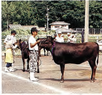
最優等牛のまるこ号

以上の受賞牛、およびその他の受賞牛は10月5日に開催される「佐世保地域共進会」、10月25日の「ながさき牛づくり振興大会」に出場する予定です。