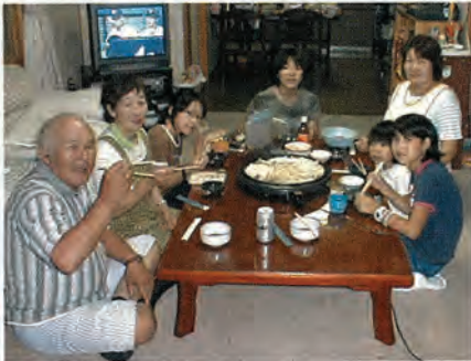
鶴川町での交流の様子