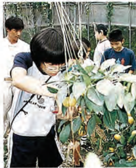
佐世保市内での交流の様子

このイベントは、両J Aが姉妹農協として提携していることから、毎年お互いの子弟を派遣し、交流を深めることと未来の農業をなう子どもたちに、南北の風土の違いや農業経営の状況などを見学させることで、より幅広い農業観をもってもらうことを目的に行われています。今年も、8月1日から4日まで、本町参加者宅で北海道からの児童を受け入れ、8月4日から7日まで北海道を訪問。農業体験では農作業を行ったり、みかん園(佐世保市)や各農業施設の見学などを行い、楽しい夏休みの体験になったようです。