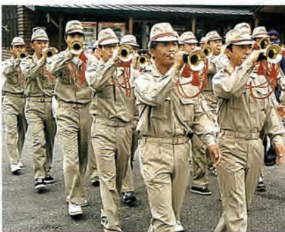
写真は、昨年行われた北松南部消防協議会（北松南部7か町）主催の合同訓練の様

佐々町消防団では、「いざ」という時のため、火災を想定した火災想定訓練に御協力ください。