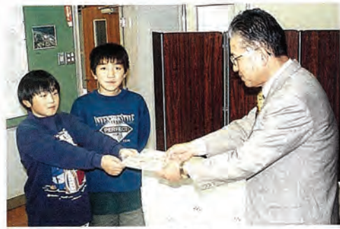
赤い羽根共同募金の贈呈式 末吉常務へ渡す佐々小学校児童のみなさん

12月1日から全国一斉に『第50回歳末たすけあい運動』が始まりました。 町内の皆さまから寄せられました温かい「歳末たすけあい義援金」は、佐々町内の在宅者で、低所得者世帯（一人暮らし老人、母子父子、障害者など）や寝たきり老人の方々へお見舞金として贈ります。 また、年末には、食生活改善推進員、民生児童委員の方々の協力により一人暮らし、二人暮らし老人、父子家