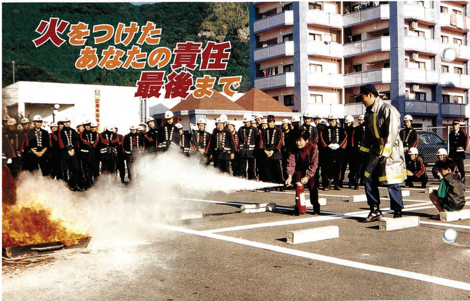
写真は11月5日に行われた火災想定訓練（関連記事 3ページ）