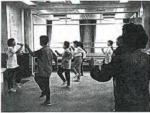
▶昨年のウォーキング体操教室から

昨年、健康相談センターで2回実施したところ、好評でしたので、国民健康保険の健康づくり事業として実施することになりました。