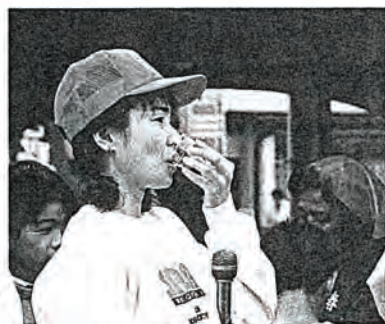
▲シロウオのおどり食いを試食