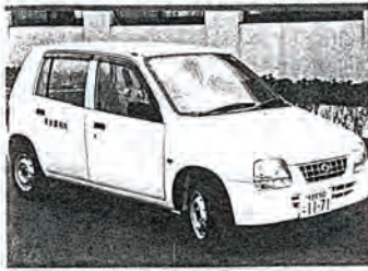
◎県共同募金会から 寄贈された軽自動車

佐々町社会福祉協議会は、町民の福祉の増進を図ることを目的として、昭和49年に法人化され、今日に至っております。 本会が行っている福祉事業は、町民皆様からの会費や寄付金、赤い羽根共同募金、町、県、国補助金などにより運営しております。 なお、この会費は、町内会長さんを通じてお願いすることになっております。 趣旨を御理解いただき、会費並びに賛助会費に対しても御協力を賜りますようよろしくお願い申し上げます。