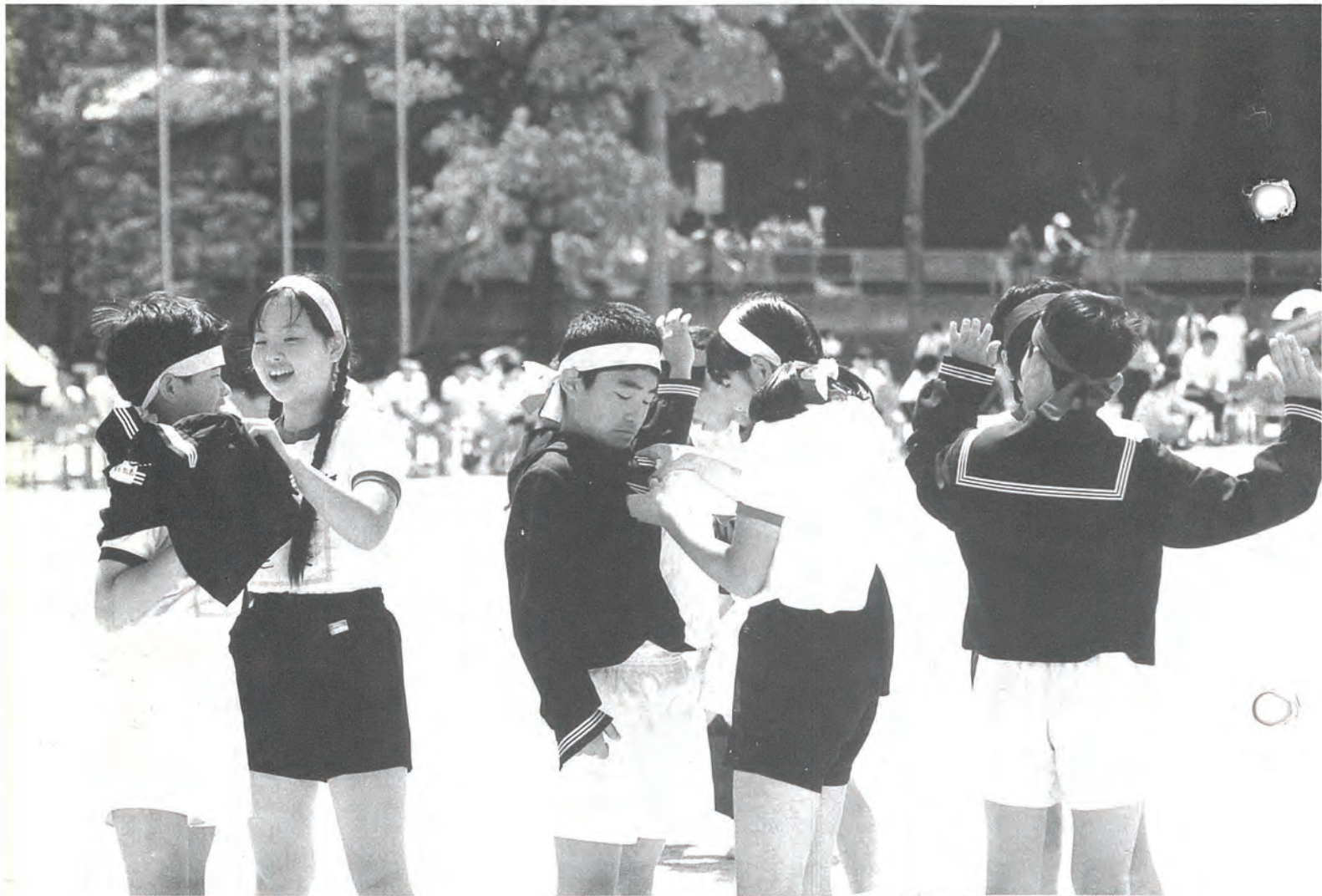
4月26日 佐々中学校運動会『ピカピカの1年生』から