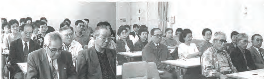
「これからの活動に役立てようと」熱心に受講されるみなさん