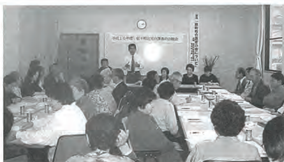
鹿町町介護者の会の役員さんとの交流