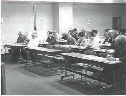
「自分史を書こう」を真剣に聞かれる出席者の皆さん