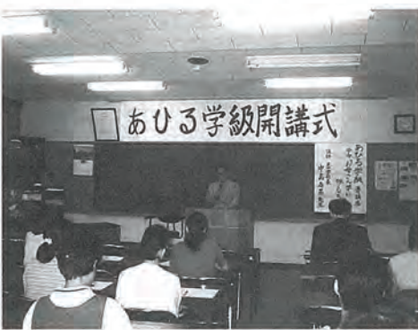
子どもといっしょに参加してみませんか