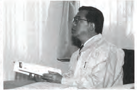
▲質問をされる金子知事 (アリアケジャパンにて)