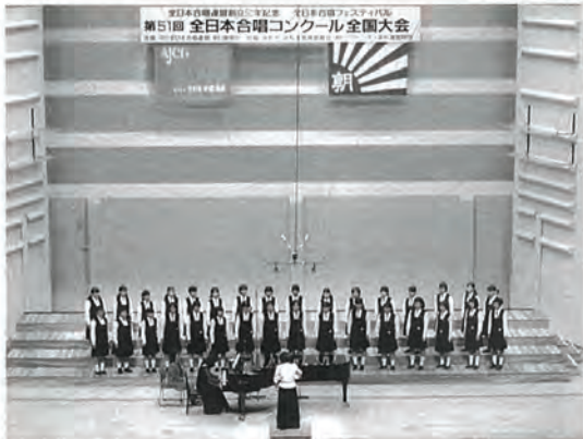
▶（写真提供） 平成10年11月1日付朝日新聞