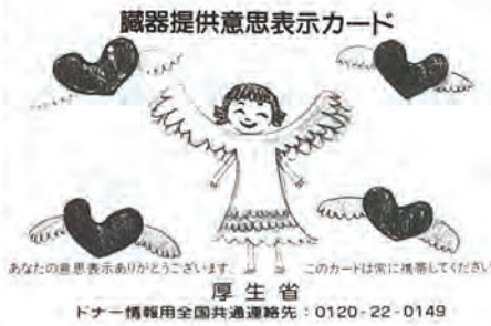
臓器提供意思表示カード あなたの意思表示ありがとうございます。このカードは常に携帯してください。 厚生省 ドナー情報用全国共通連絡先：0120-22-0149