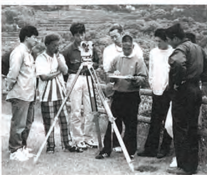
▶写真は、測量実習の スナップから。