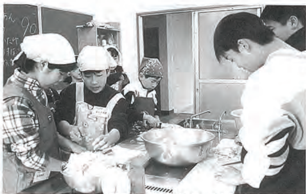
学校週5日制にともなう「土曜学級」

平成9年度についても、その推進を継続的に実施するもの、新たに加える学習事業計画等、近々ご紹介いたします。ぜひ実践していただくようお勧めします。