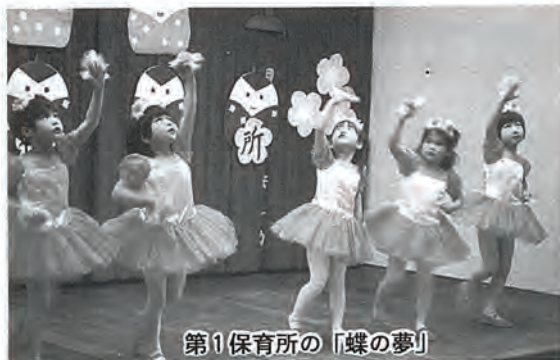
第1保育所の「蝶の夢」

町立第1、第2、第3保育所園児65名が老人福祉センターの大広間で、町内の一人暮らしやデイサービスに通所されている方々に、色とりどりの衣装をつけて、次々に遊戯を披露、園児のかわいい遊戯にみとれて会場からは、大きな拍手が送られていました。