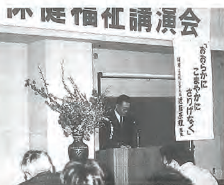
に日本消防協会長から竿頭授 が贈られました。

また、佐々町消防団は、昭和22年発足以来50年、風水害による警防活動をはじめ、火災予防のための施設を充実、また、町民に対し防火思想の普及と防火協力の要請をするなど火災予防に努め、水防についても危険箇所の見直しと防災対策、さらに団員の育成と幅広い活動を展開した優良組織として、消防庁長官並び