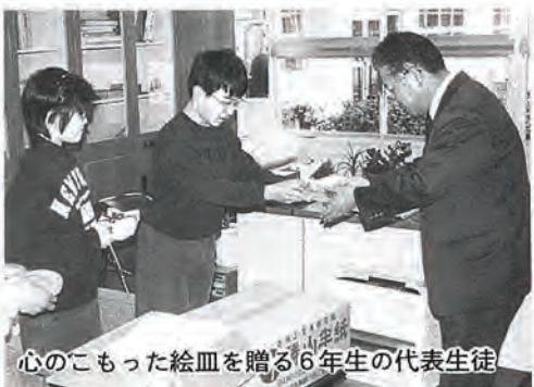
心のもった絵画を贈る6年生の代表生徒

りたいへん喜ばれています。今年、動物や花などを描いて焼いたかわいい絵皿が完成、地区担当の民生児童委員さんを通じて、届けられました。