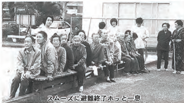
スムーズに避難終了ホッと一息

老人福祉センター利用者やデイサービス通所者の方々が老人福祉センターボイラー室の火災を想定し、職員の誘導で避難訓練を行いました。老人福祉センターでは、春と秋に年二回の避難訓練を行っています。