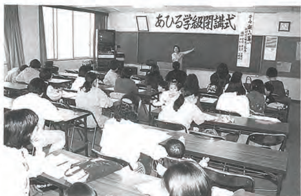
〈あひる学級(乳幼児学級)終了〉

〈力をあわせて楽しいごちそうづくり〉 (小中学生19名が終了) 町健康センター関係者、みどり会の皆さんの協力が大きかった。