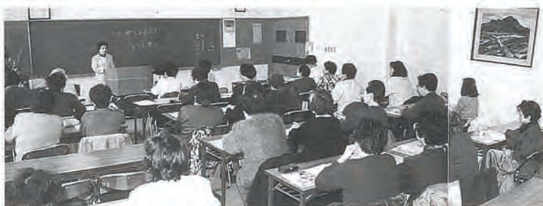
写真は、さざん花婦人学級による「賢い消費者になるため」の受講スナップ

そのほか婦人に関する公民館学習グループに趣味講座の活動を生かしたボランティアの姿を見ることができました。