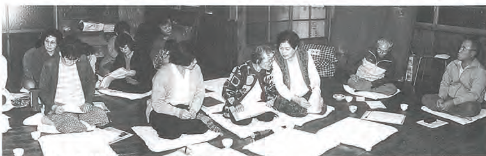
写真は、「楽しい仲間づくり」についての話し合い これまで、「趣味講座」や「映画視聴」などで、顔合わせをする集いを大事にされました。

生涯学習は、家族ひとりひとりが明るく楽しいなごやかな家庭をつくる基礎となる。また隣り近所が明るくなることを考え開設されました。