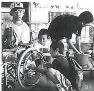
県立コロニーで車イス磨き

2日目は、佐世保市にある県立コロニーへ出かけ、所長さんや自治会役員の方々のお話を聞いた後、車イスや手すり磨きなどのボランティア活動を行ない身体が健康であることの大切さを学びました。