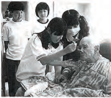
食事介助はたいへんです。

れあい交流や、役場、佐々駅、大型スーパー店や公園を回り車イス介助、アイマスクの体験活動を行いました。