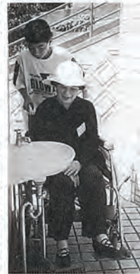
とさん力協社福 とさん力協社福 とさん力協社福

普段、高齢者と接する機会が少ない児童生徒の皆さん方は、施設の指導員さんたちから説明を聞き、真剣に取り組んでいました。