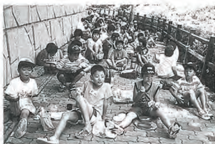
休息のひととき(皿山公園)

いろいろな活動を通して、新しい友達もたくさんでき仲間集団の生活ができました。(参加者62名)