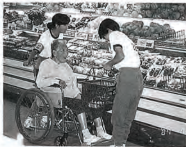
大型スーパー店で買物介助。