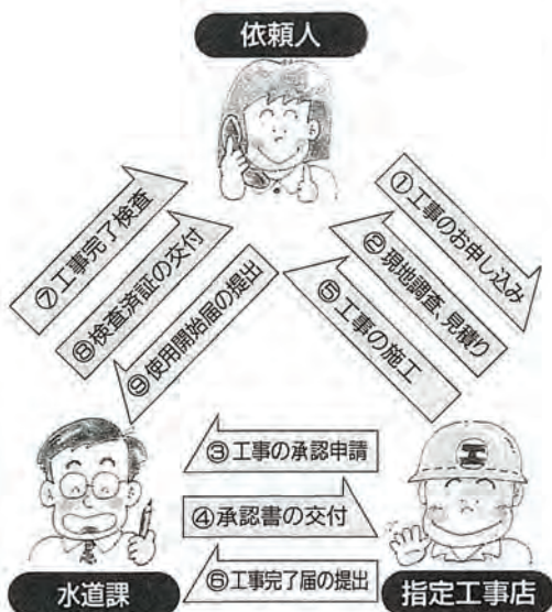
〈図面(区域)のお問合せは水道課へ〉