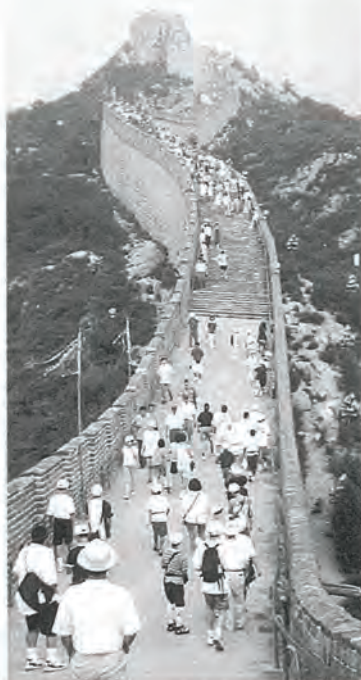
写真は、中国「万里の長城」