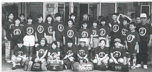
写真は、出発式を終えた団員スナップ(佐々町公民館)