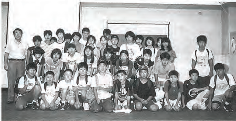
写真は研修を終えたリーダーと指導者