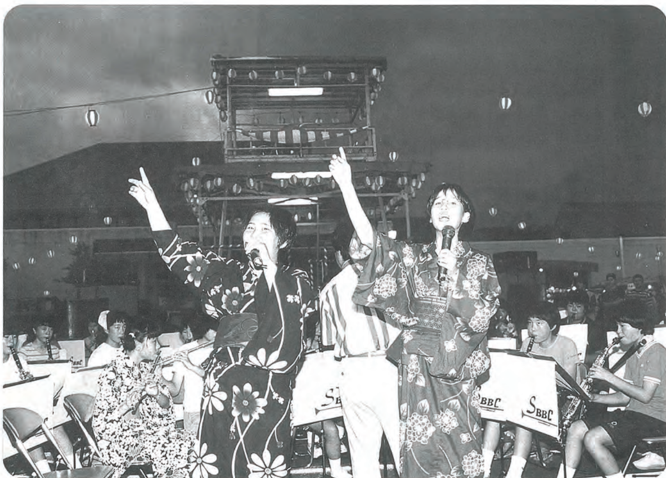
8/16 第34回 夏祭りから