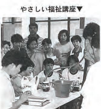
やさしい福祉講座▼