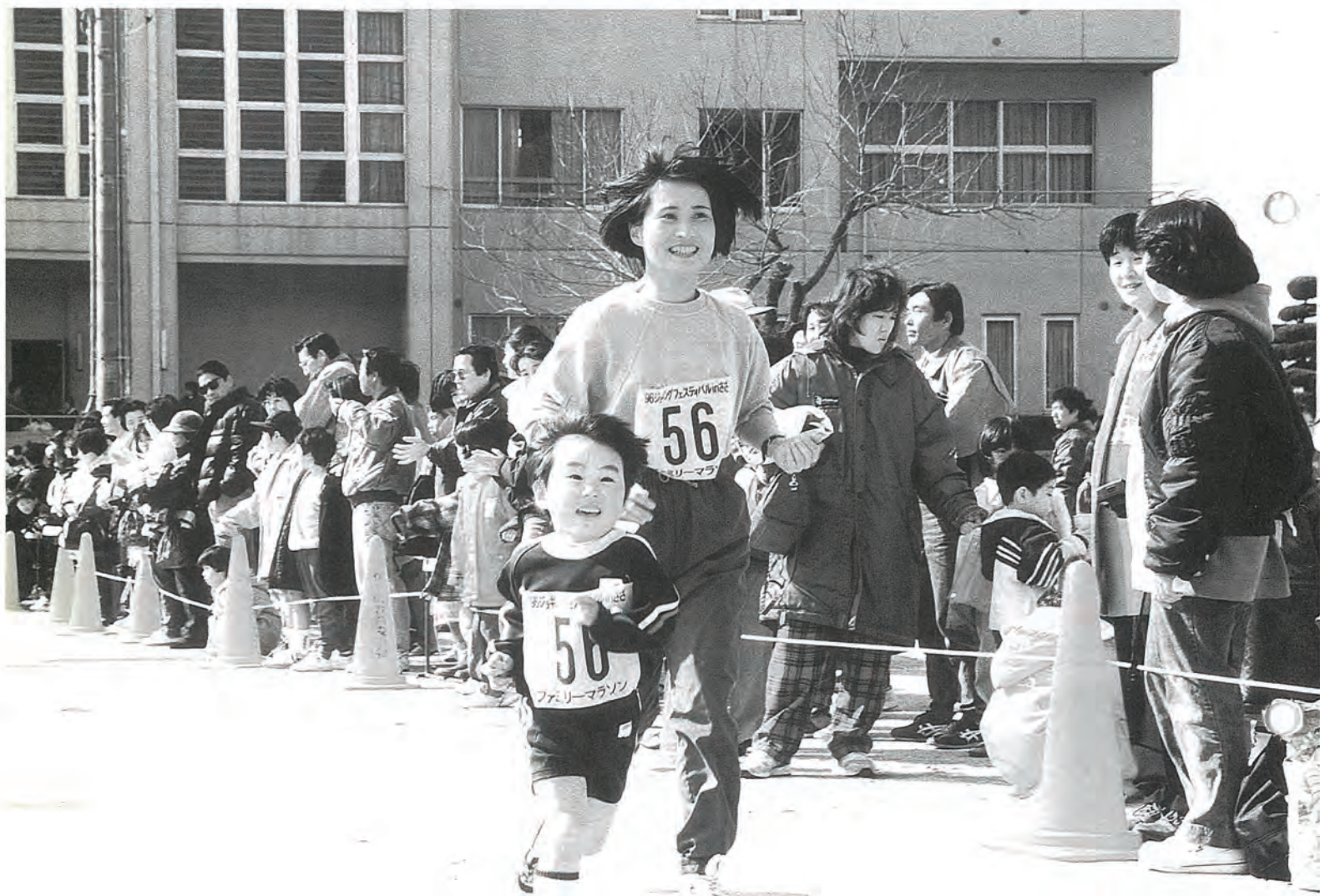
“1.5 kmを走り切ってさわやかなゴール” (3/10「ジョギングフェスティバルINさざ」から)