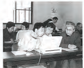
字を見つけるのにひと苦労