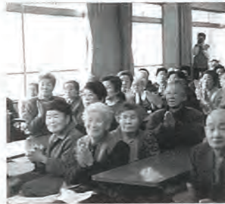
「かわいい、上手ねえ」と惜しみない拍手がおくられました。