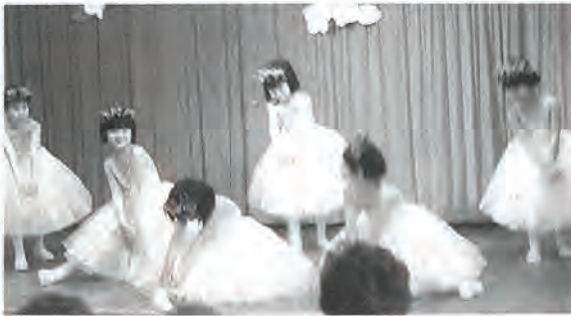
花のバレリーナを踊る第二保育所の5歳園児

社会福祉協議会では、毎月各地区の公民館で一人暮らし高齢者の会食サービスを行っています。三月は、老人福祉センターで合同会食を行いました。町立の三保育所園児によるかわいいお遊戯で、参加された高齢者の方々の心を和ませました。